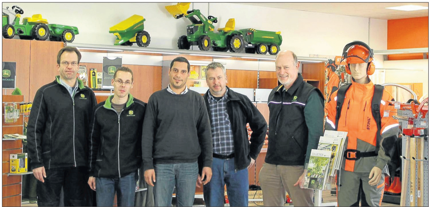
Am Service-Tresen werden die Kunden von den erfahrenen Mitarbeitern empfangen.