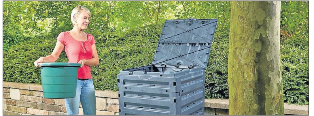
Wer in seinem Garten einen Komposter aufstellt, hat immer besten Humus zur Verfügung.

chem Recycling-Kunststoff hergestellt und sind UV- und witterungsbeständig. Um den Verrottungsprozess zu starten, empfiehlt sich bei der Erstbefüllung sperriges Material wie zerkleinerte Zweige als unterste Schicht. Bei der weiteren Befüllung gilt: Die Mischung macht's. Garten- und Küchenabfälle, sehr nasse und trockene Bio-Reste sollten möglichst gemischt eingefüllt werden. Für guten Kompost sollte der Aufstellort gut gewählt werden.