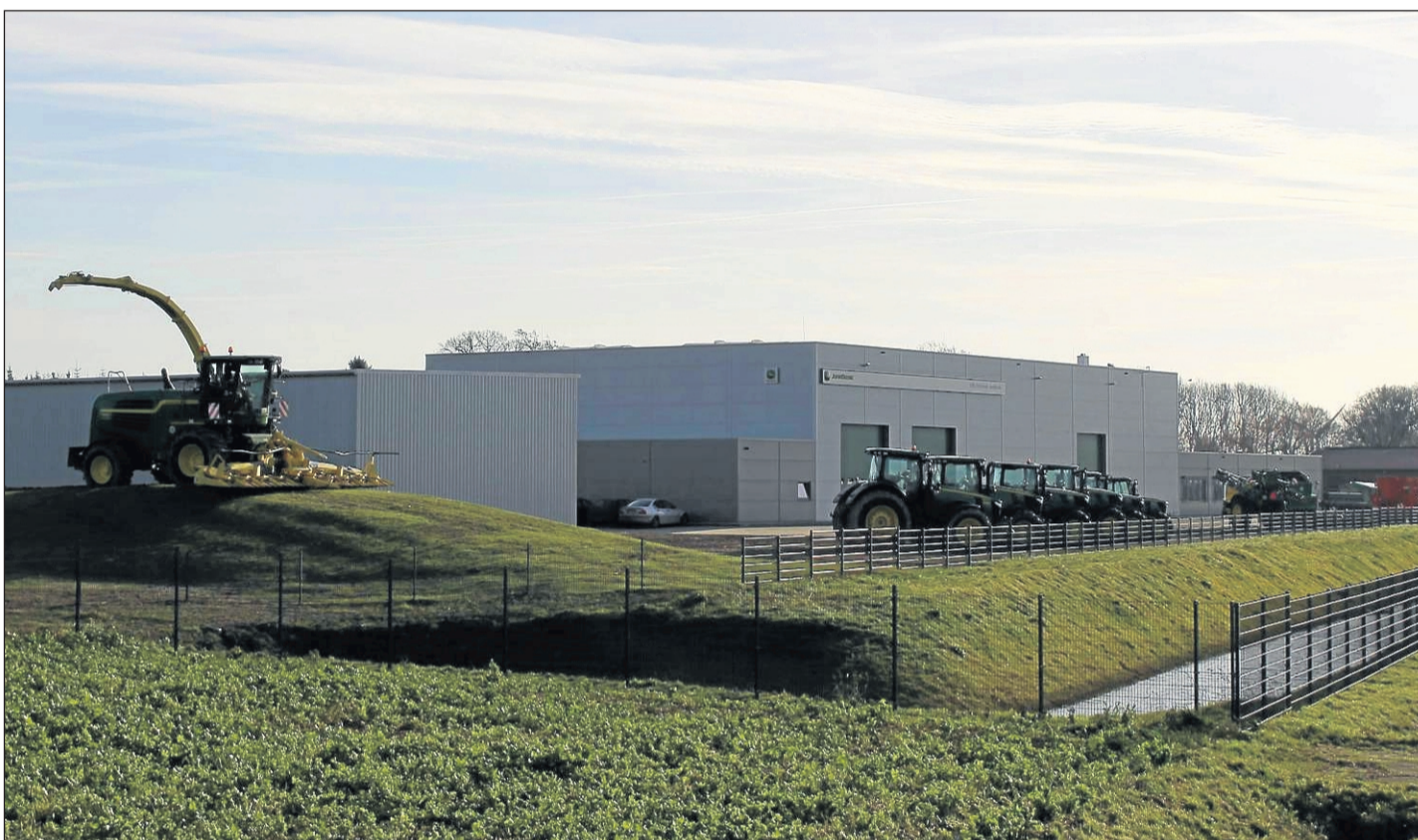
Das große Gelände der LVB Steinbrink in Tätendorf-Eppensen.